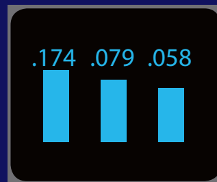
Gráfico de Tres Lecturas

La precisión a la milésima de un punto porcentual